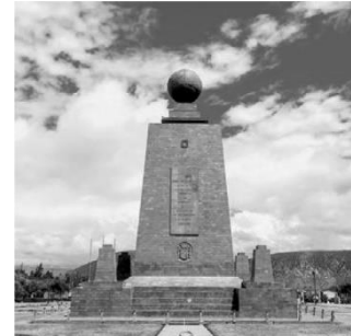
Střed světa – Mitad del Mundo s třicetimetrovým památníkem

a) Zjisti, kolika státy a kolika oceány rovník prochází.